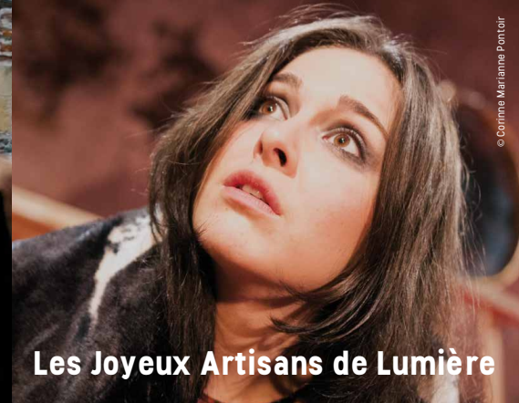
Les Joyeux Artisans de Lumière