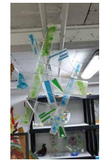
N°97 · Entremêlés