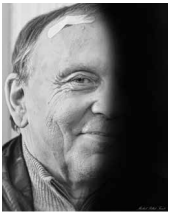
N°93 · Christian Bobin