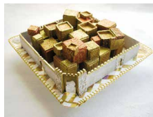
N°62 • Ville Or

Carton, sable, acrylique, fil à broder 30 x 30 x 15cm