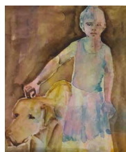
N°13 • Soutien 22 x 17 cm • 55€