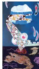
N°83 · Les dragons 50 x 87 cm • 530€

malval.laurence1@gmail.com • 06 85 85 82 21