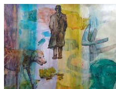
N°10 • Boomerang 42 x 32 cm • 100€

laurencecazauran@gmail.com • 06 21 15 43 49