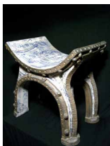
N°82 · Siège 18 x 48 x 32cm • 650€