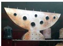
N°81 · Chandelier 35 x 69 x 11 cm • 650€