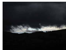
N°88 · Jour noir 40 x 50 cm • 55€