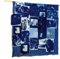
N°94 à N°95 · Dialectiques

dorotheeremlinger71@gmail.com • 06 12 93 87 99