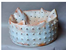
N°75 · Cratère après Boisbelle 1 Ø 45 x 30 cm • 600€