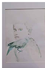
N°16 • L'enfant et l'oiseau 42 x 52 cm • 165€