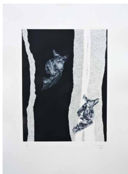
N°7 • Apparition II • Gravure 62 x 82 cm • 370€