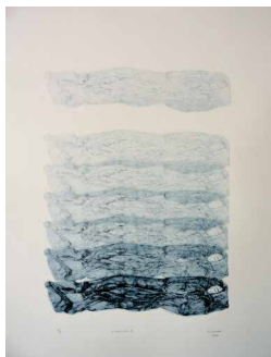
N°8 • Disparition I • Gravure 62 x 82 cm • 370€