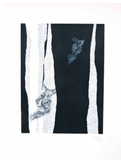
N°6 • Apparition I • Gravure 62 x 82 cm • 370€