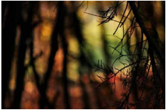
N°90 · Vitrail