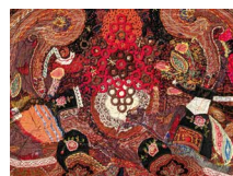
N°87 · La danse 80 x 115 cm • 1200€