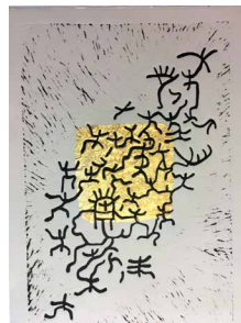
N°5 • Envol , 2022