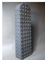
N°70 • Borne noire