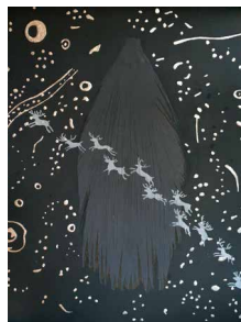
N°3 • La Nuit , 2021

claudette-bernard@hotmail.fr • 06 06 66 18 74