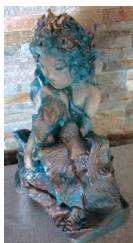
N°59 • Fetopia