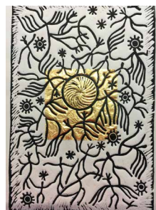
N°5b • Dans le ciel , 2022