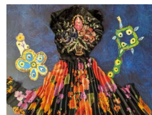
N°86 · Sur la colline 70 x 50 cm • 480€