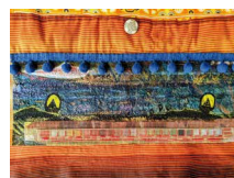
N°85 · Paysage 44 x 50 cm • 350€