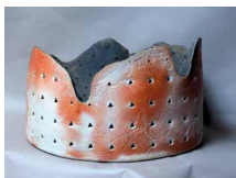
N°77 · Cratère après Boisbelle 3 Ø 46 x 27 cm • 600€