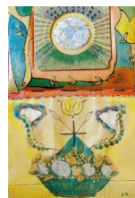
N°84 · L'abondance 30 x 38 cm • 320€