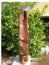
N°78 · Château d'eau 114 x 21 x 22 cm • 1250€