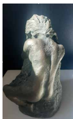
N°61 • Eva