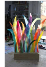
N°96 · Feuillages

cma.thivent59@orange.fr • 06 50 74 96 42