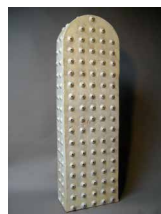
N°71 • Borne blanche