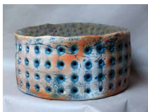
N°76 · Cratère après Boisbelle 2 Ø 46 x 23 cm • 600€