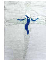
N°99 · En Résurrection