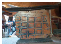
N°69 • Grand vase carré