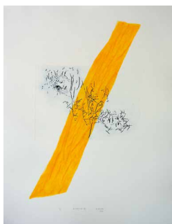
N°9 • Disparition III • Gravure 62 x 82 cm • 370€