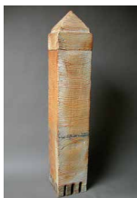
N°79 · Tour carrée 115 x 21 x 22 cm • 1250€