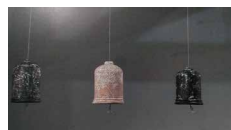
N°63 à N°68 • Cloche 1 à 6