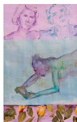
N°15 • Trois éléments 26 x 32 cm • 80€