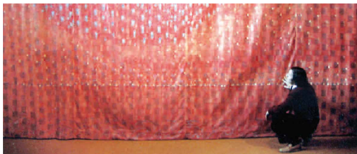
N°2 • Lumière 2 • Acrylique sur toile, 1982 • 460 x 300 cm