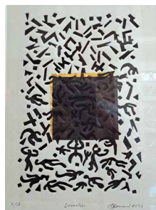
N°4 • Désastre , 2022